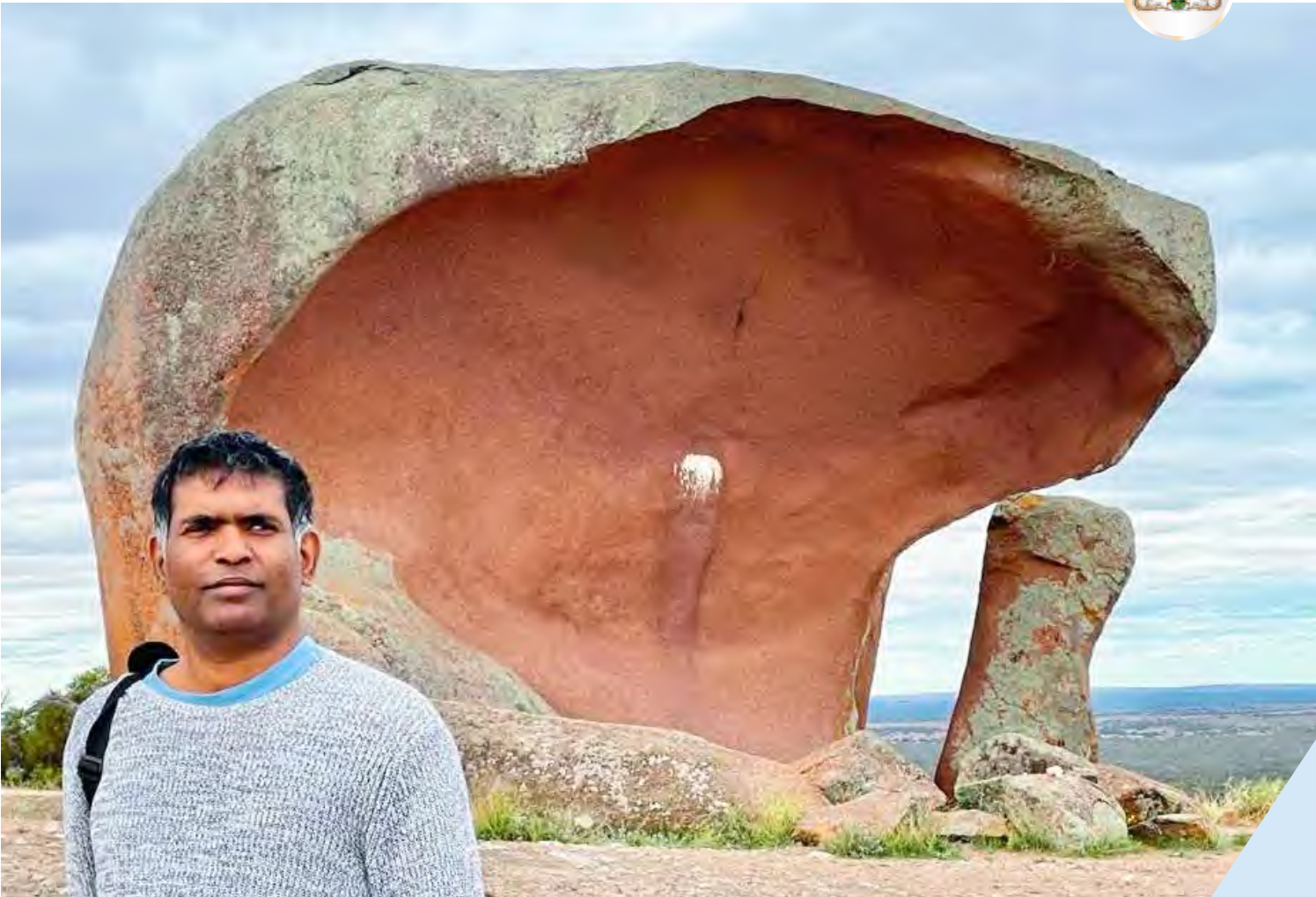
മർഫീസ് ഹേ സ്റ്റാക്സ്

പാറയിൽ പതിക്കുമ്പോൾ അതിന് ചിലപ്പോൾ വ്യത്യസ്തമായ നിറങ്ങളും സമ്മാനിക്കാറുണ്ട്.