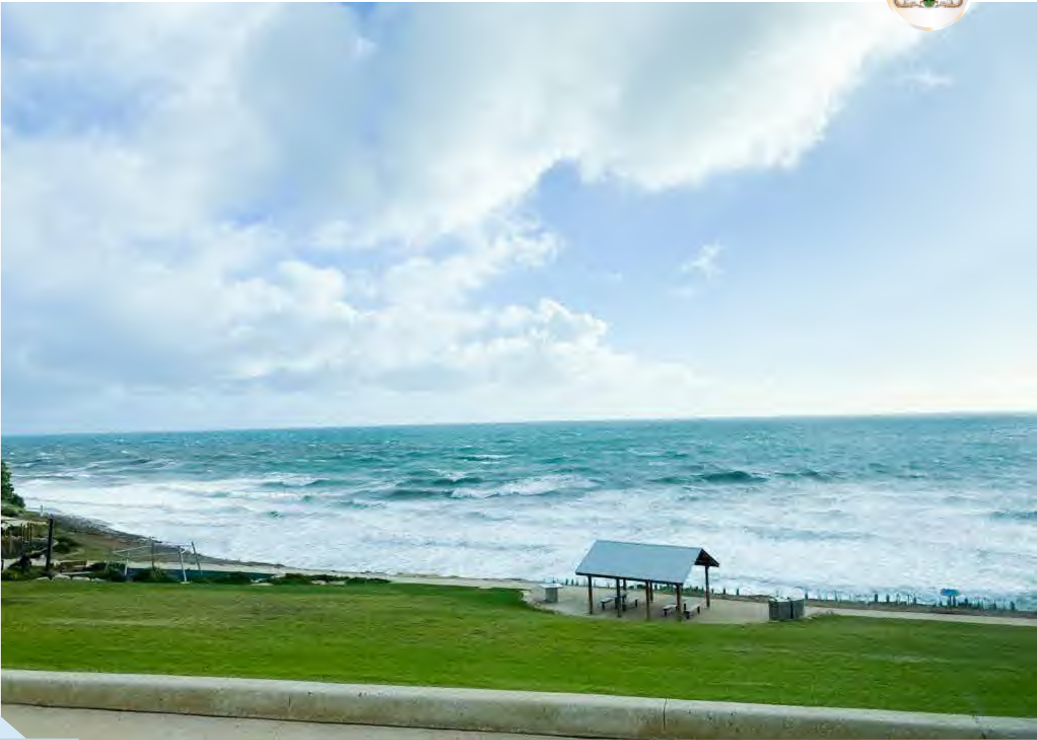
ഹാലറ്റ് കോവ് ബീച്ച്

യെത്തുന്ന ഓരോ സന്ദർശകനോടും പറയാനുണ്ടാകും.